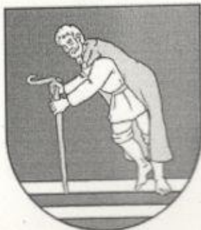
erb obce.jpg 15K